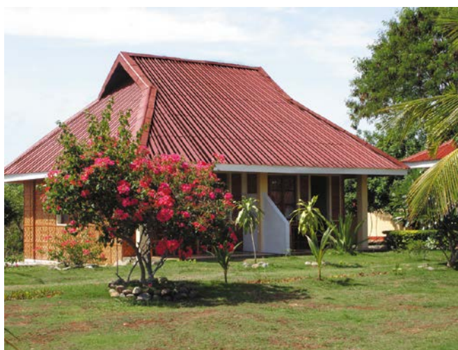
Telha Design Duo

A Telha Onduclair está disponível nas versões transparente e fumê. Ela é feita de policarbonato e é ideal para ser utilizada em garagens, corredores, jardins de inverno e outros locais com pouca iluminação. Proporciona proteção UV e propõe iluminação natural aos ambientes, além de agregar um visual especial ao telhado.